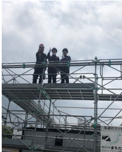
↑ 安全帯をつけて実際に足場の上を歩く体験