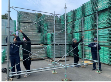
↑ 簡単な足場の組立て体験